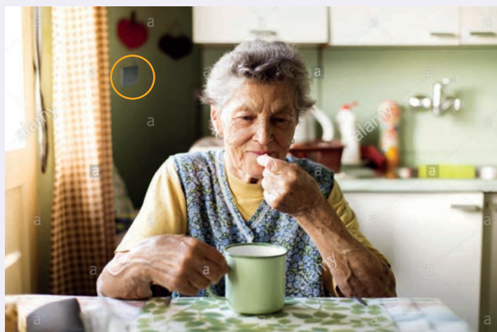
Installationen af multiGuard® Senior er enkel og griber ikke ind i den ældres dagligdag.

Ved blot at sende en sms indstilles, hvem der skal have beskeden og hvornår beskeden skal sendes.