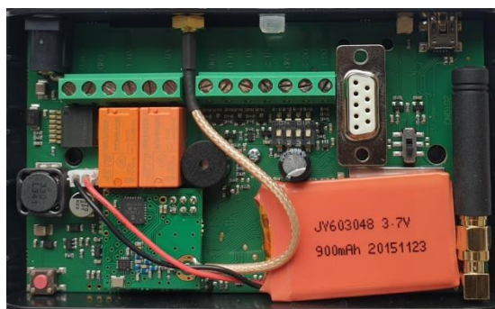
Placering af batteri.