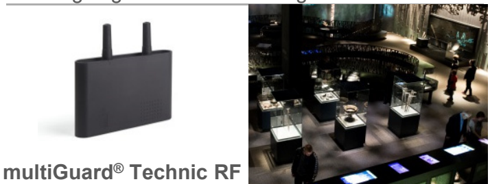
multiGuard® Technic RF