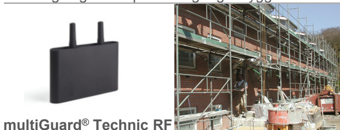
multiGuard® Technic RF